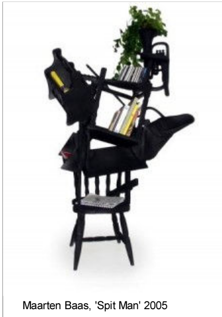
Maarten Baas, 'Spit Man' 2005

De vraag is dus of deze discussie om het 'vak' vrije vormgeving in kaart te brengen nog wel relevant is in een periode waarin alles door elkaar loopt. Ooit 'vielen' de vrije vormgevers voor een materiaal en de technische uitdagingen die het bood. Kijk naar glasblazers in actie en je voelt via de loeiende oven haast lichamelijk de hete adem uit de oudheid blazen. Het mag romantisch klinken maar keramisten waarderen werkelijk het aardse en nederige van 'hun' materiaal dat even snel weer verkrummelt als het vorm krijgt. Sieradenmakers daarentegen verbreedden juist hun materiaalkeuze waardoor hun ondraagbare objecten zij aan zij kwamen te staan met de in vergetelheid geraakte 'kleinsculptuur'. En verwarrend genoeg, winkelen conceptuele productontwerpers sinds een jaar of vijftien in de ambachten. Voorbijgaand aan technische kwaliteiten en uitdagingen selecteren zij een ambacht vooral op de stilistische waarde. Marcel Wanders was bijvoorbeeld heus niet geïnteresseerd in het opwaarderen van het macrameeën toen hij (met een technisch medewerkster weliswaar) zijn beroemde Knotted Chair ontwikkelde.